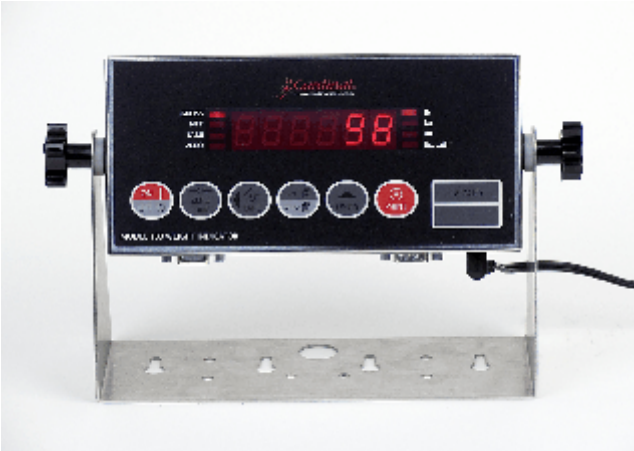
Typical Model 180 / Modèle 180 typique