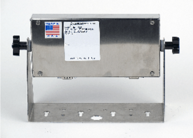
Model 180 Back Cover / Panneau arrière du modèle 180